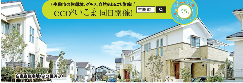
白庭台住宅地(※分譲済み)